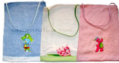
(EJEMPLO TOALLA DE HÁBITOS HIGIÉNICOS)

ESTOS ÚTILES DE USO DOMÉSTICO Y DEBERÁN ESTAR TODOS LOS DÍAS EN LA MOCHILA DEL ALUMNO/A Y PERIODICAMENTE DEBEN SER REVISADOS POR EL APODERADO, LAVADOS Y CAMBIADOS SI FUESE NECESARIO.